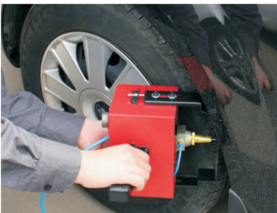
Портативная голова с размером рабочего окна 75x25мм