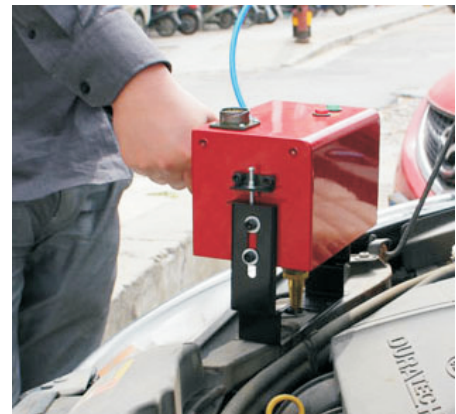
Портативная голова с размером рабочего окна 50x25мм