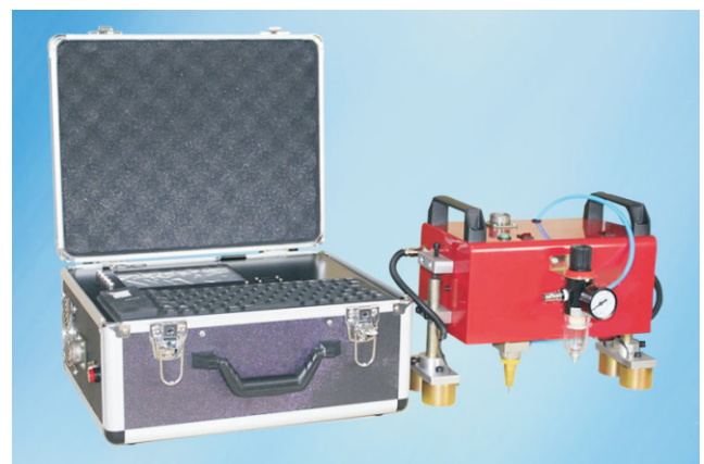
Портативная голова с окном 150x50мм в комплекте с контроллером RDP-A